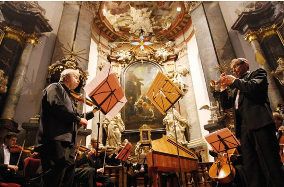
Smirzickie Uroczystości Muzyczne

Kraj Kralowohradecki to miejsce, gdzie odbywa się wiele znaczących festiwali.