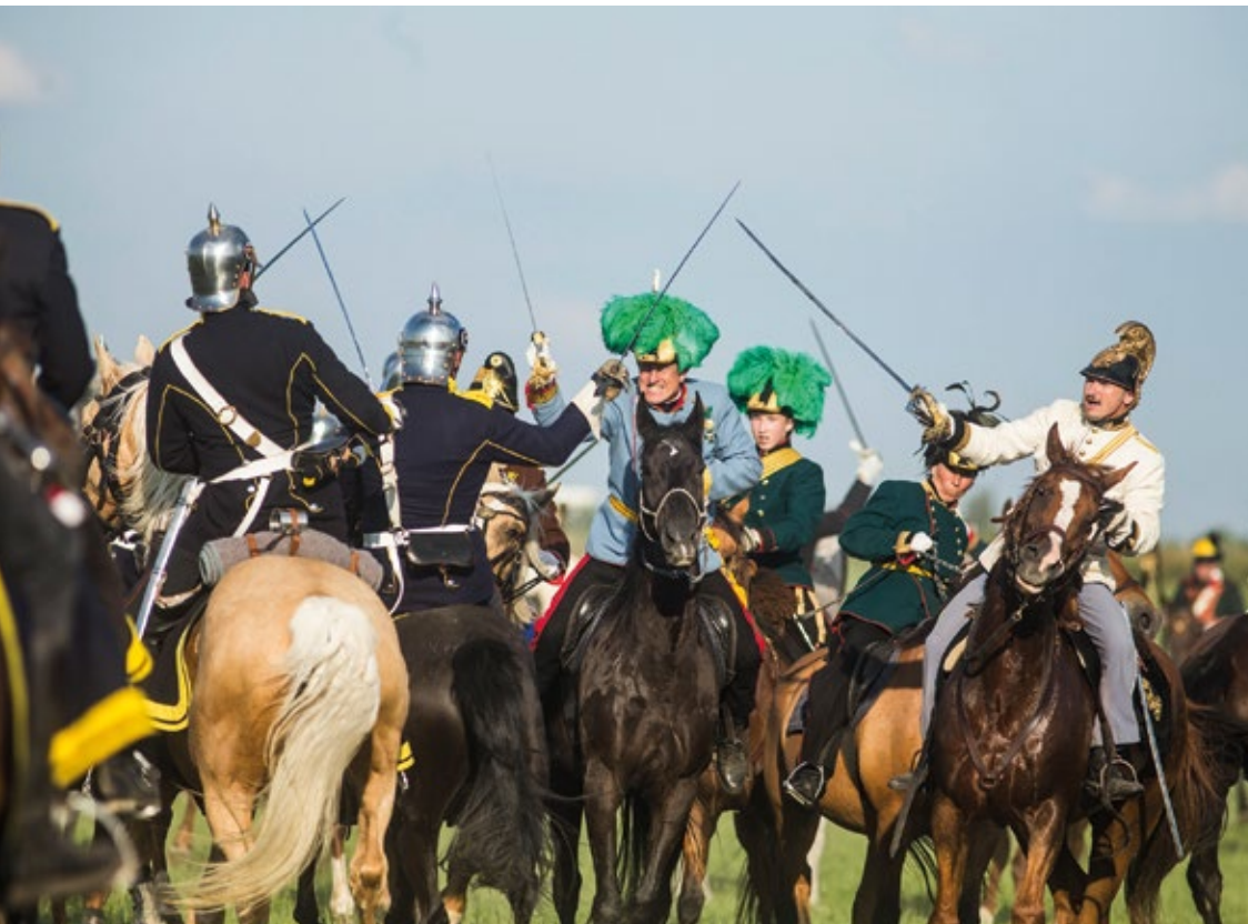
Rekonstrukcja bitwy koło Hradca Králové

Wojny i bitwy stanowią niestety nieodłączny element naszej historii, która w tragiczny sposób naznaczyła wiele miejsc.