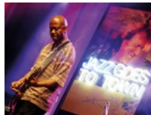
Jazz Goes to Town