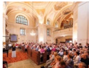
W poszukiwaniu skarbów Broumowskiego