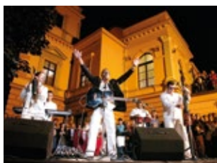
Teatr Regionów Europejskich

Festiwal międzynarodowy Teatr Regionów Europejskich (czes. Mezinárodní festival divadlo evropských regionů) w Hradcu Králové to największy przegląd teatralny w Republice Czeskiej. Teatrem żyje wówczas dosłownie całe miasto. Zwiedzający mają w ciągu dziesięciu dni możliwość zobaczyć szeroką ofertę inscenizacji teatralnych w najróżniejszych stylach i rodzajach. Elementem festiwalu są również tradycyjne koncerty i spotkania z interesującymi gośćmi ze sfery czeskiego teatru, filmu i sztuki plastycznych. Już tradycyjnie częścią składową festiwalu jest Open Air Program , pozakonkursowy przegląd krajowej i zagranicznej sztuki, głównie sztuki teatralnej. Duża część występów muzycznych i tanecznych odbywa się na ulicach miasta.