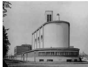
Zbór księdza Ambrožego