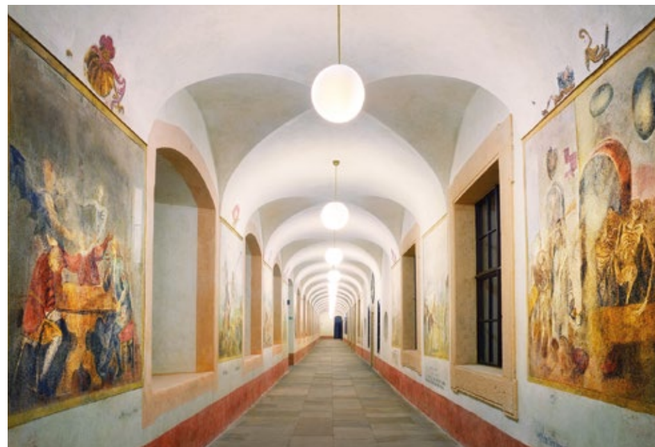
Malowidła ścienne Taniec Śmierci