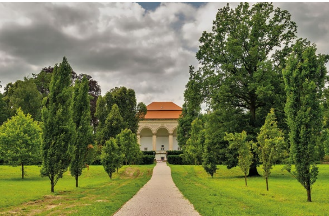
Valdštejnská lodžie, Jičín