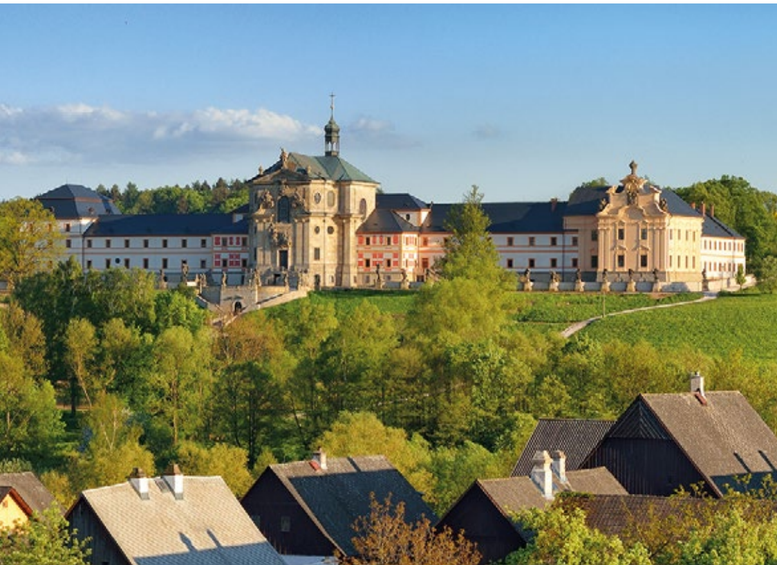
Hospicjum i szpital Kuks

Kompleks Kuks wraz z swoją unikalną atmosferą jest jednym z najcenniejszych klejnotów szczytowego okresu baroku w Czechach.