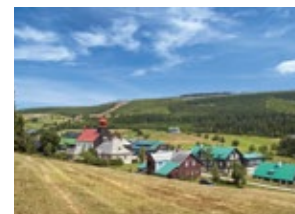
Miejscowość Malá Úpa

Swoje źródła ma tutaj Łaba i niektóre pozostałe rzeki. Na rzekach spływających ze grzbietów Karkonoszy znajdują się również trzy najwyższe wodospady w Republice Czeskiej – Wodospad Panczawy (czes. Pančavský vodopád) (całkowita wysokość 148 m), Górný Wodospad Upy (czes. Horní úpský vodopád) (129 m) i Wodospad Pudlawski (czes. Pudlavský vodopád) (122 m).