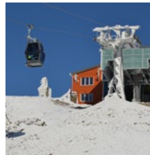
Kolejka linowa na Śnieżkę

Śnieżka 1603 m n. m. 50°44 10 N, 15°44 25 E