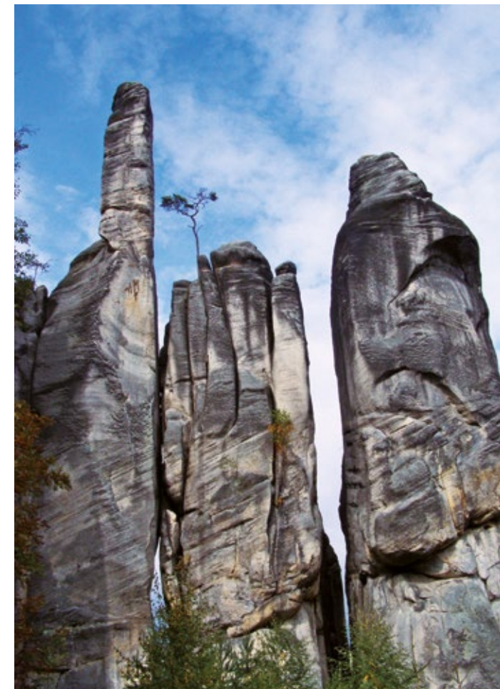
Skały Adrspasko-Teplickie (Adršpaško-teplické skály)

Samotnie stojącą górą stołową Ostaš spowija szereg legend, od których swoje nazwy otrzymały niektóre formacje skalne. Złożona jest z dwóch miast skalnych – tzw. Horní i Dolní labyrint. Północno-wschodnie zbocze góry nosi nazwę Kočičí skály. Dolni labyrint ukrywa trzydziestometrową grotę nazwaną Sluj českých bratří, gdzie według legendy prześladowani ewangelicy odbywali tajne nabożeństwa.