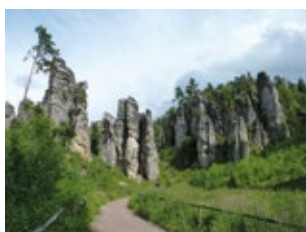
Prachowskie skały (Prachovské skály)

Piaskowcowe miasta skalne – to głębokie jary, wąskie wąwozy, wysokie wieże, niezwykle formacje, okna skalne.