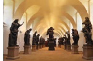
Lapidarium rzeźb M. B. Brauna

Hospicjum i szpital Kuks kuks@npu.cz +420 499 692 161 / +420 724 663 535 www.hospital-kuks.cz www.zkuskuks.cz Kuks 81, 544 43 Kuks 50°23'51.836"N, 15°53'22.102"E