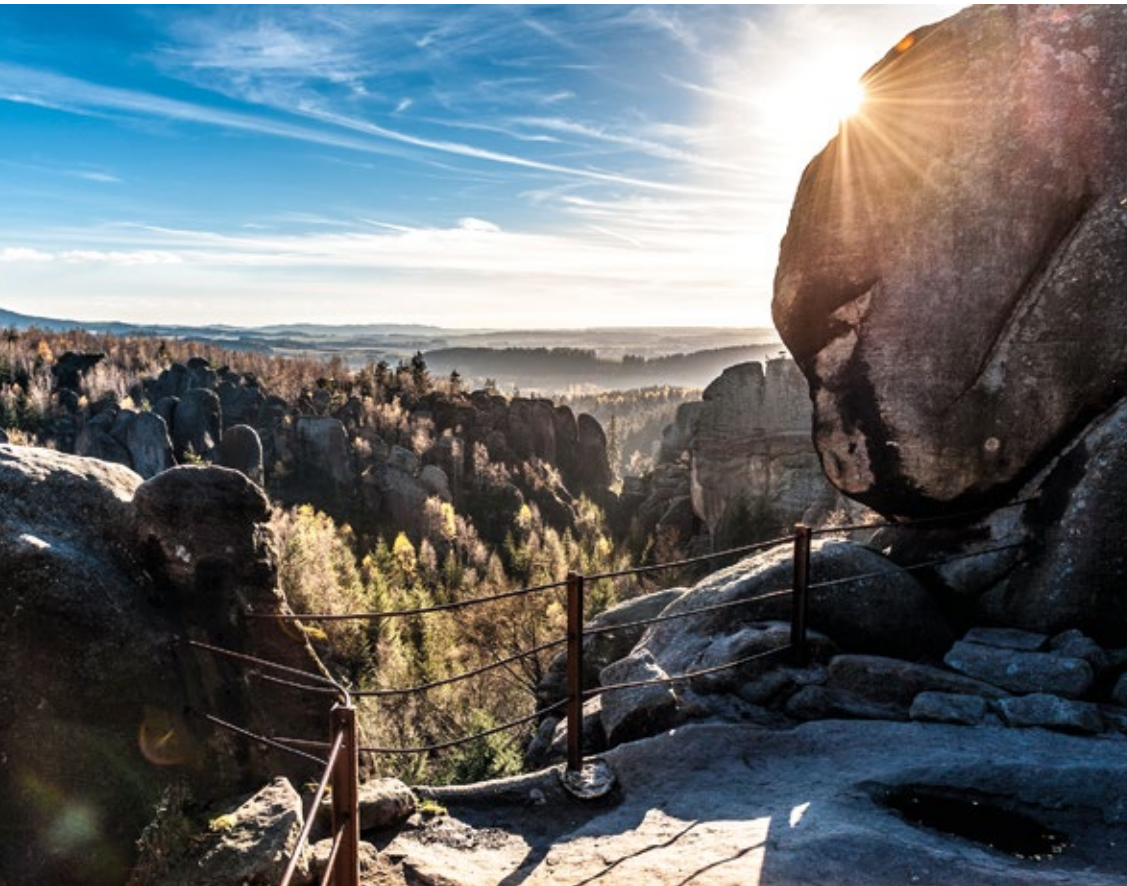
Broumowskie ściany (Broumovské stěny)

Piaskowcowe miasta skalne – to głębokie jary, wąskie wąwozy, wysokie wieże, niezwykle formacje, okna skalne.