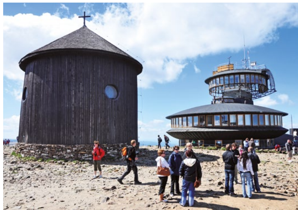
Śnieżka - kaplica św. Wawrzyńca

Od czasów średniowiecza przychodzili do Karkonoszy poszukiwacze szlachetnych kruszców oraz górnicy, którzy ze skalnego wnętrza Śnieżki wydobywali miedź, żelazo i przede wszystkim arsen. Po działalności górniczej pozostał tutaj labirynt chodników, szybów i wielkich komór, które jeszcze dzisiaj można zobaczyć na własne oczy. Wyposażeni w kombinezony, kaski z lampami i rękawice mogą Państwo zwiedzić nie tylko około 250 m unikalnych pomieszczeń wydobywczych, ale również na własnej skórze wypróbować pracę średniowiecznych górników. Wejście do zabytkowej kopalni Kovárna znajduje się w dolinie Obrí důl na wysokości ponad 1000 m n. p. m.