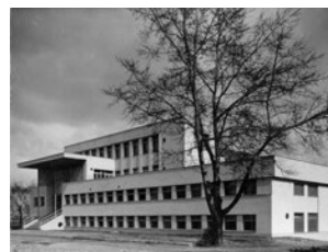
Stadtbäder (derzeit Stadtbäder Aquacentrum)

Wpływ na wygląd miasta w wyraźny sposób wywarł również jego uczeń Josef Gočár , który między innymi wybudował tutaj schody z ulicy Na Kropáčce na ulicę Komenského, obiekt danej Państwowej Szkoły Zawodowej Garbarstwa, kompleks szkolny na prawym brzegu Łaby, zawierającym dawną państwową szkołę średnią Rašínovo gymnázium, a zwłaszcza nowoczesny zbór Czechosłowackiego Kościoła Husyckiego. Jego autorstwa są również place miejskie Ulrichovo náměstí i Masarykovo náměstí.