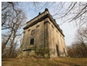
Loreta w miejscowości Podhradí