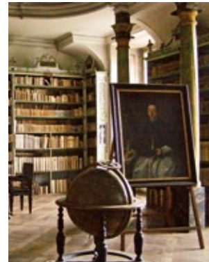
Biblioteka Klasztoru Broumov

Centrum kompleksu klasztorowego tworzy pierwotnie gotycki kościół św. Wojciecha , który został w latach 1685–1688 przebudowany w stylu barokowym pod kierownictwem mistrza budowniczego Marcina Allia z Löwenthalu. W latach 1721–1723 przebudowę zakończył Kilian Ignacy Dientzenhofer. W latach 70-tych ubiegłego wieku w małej wieży (dzwon-