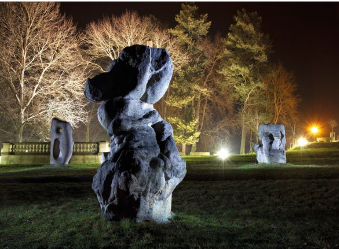
Park rzeźby na wzgórzu św. Gotharda w miejscowości Hořice

Dowodem umiejętności ludzkich są liczne rzemiosła tradycyjne, które są stale uprawiane.