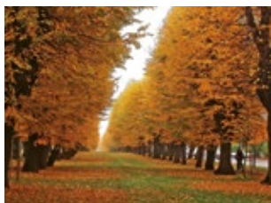
Aleja lipowa Waldsteina, Jičín