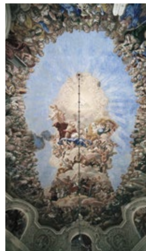
Kościół Wszystkich Świętych Heřmánkovice (fresk)

Następnym unikatowym zabytkiem kultury stanowi drewniany cmentarny kościół Matki Boskiej w miejscowości Broumov. Dawna świątynia została spalona przez wojska husyckie w roku 1421, a jej obecny wygląd pochodzi z czasów około połowy XV wieku.