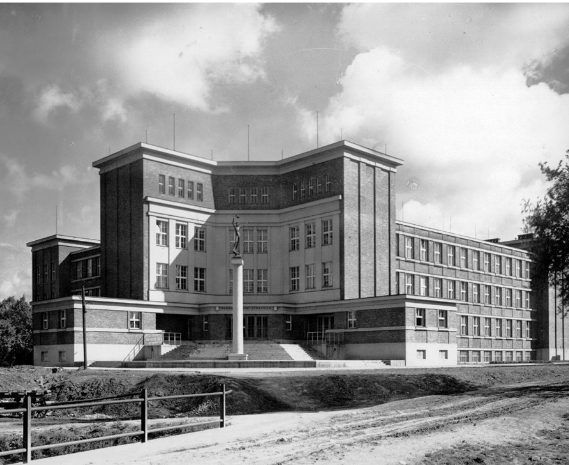
Państwowa szkoła średnia Rašínovo gymnázium (Obecnie Gymnázium J. K. Tyla)

W okresie międzywojennym powstał w Hradcu Králové urbanistyczny kompleks, który ze względu na swój charakter otrzymał nazwę „Salonu Republiki“.