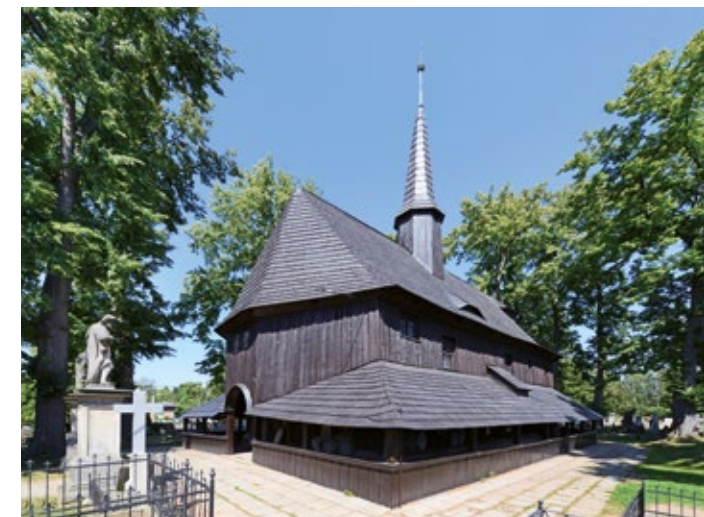
Kościół cmentarny Matki Boskiej w miejscowości Broumov