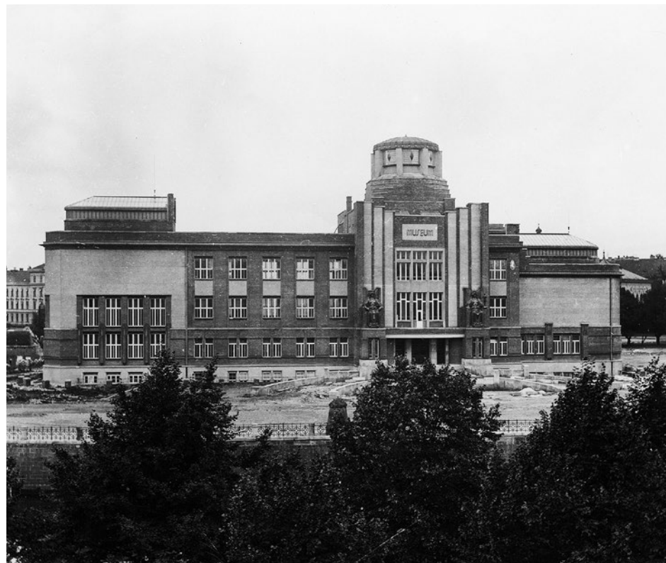
Muzeum Miejskie (obecnie Muzeum východních Čech)

Dzięki nim powstało modernistyczne funkcjonalne miasto, które było inspiracją i kontynuuje to dziedzictwo do dnia dzisiejszego jako jedno z najlepszych miejsc dla życia w Republice Czeskiej.