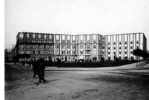
Obiekt Banku Anglo-československá banka (obecnie Masarykovo náměstí)

Miasto Hradec Králové www.hradeckralove.org